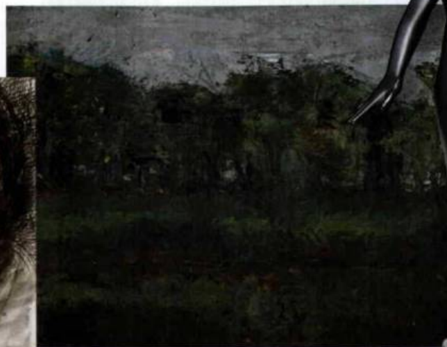
James Ensor - « Orée du bois » - 1877