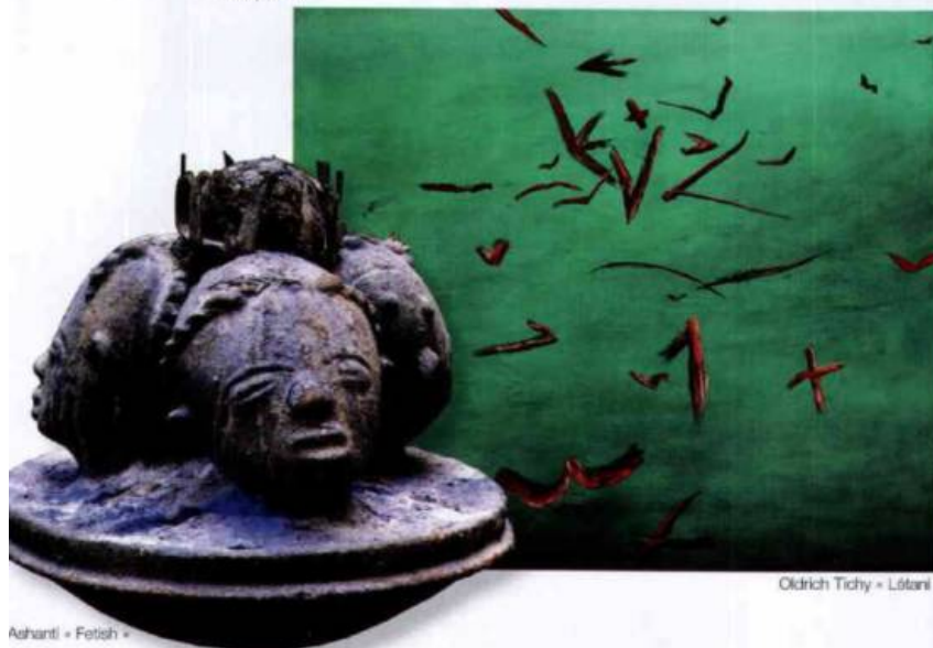
Ashanti « Fetish »