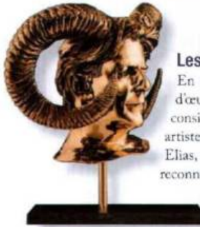
Jan Fabre - « Zeitportret »