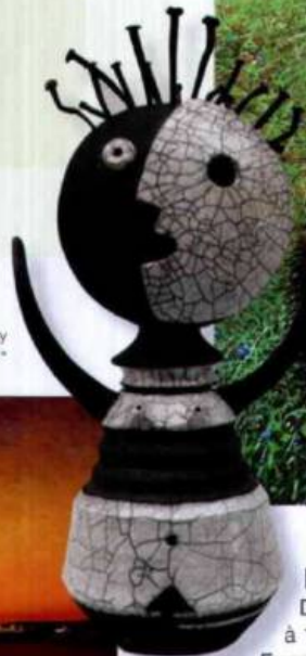
Gilette Fosty « Idôle »