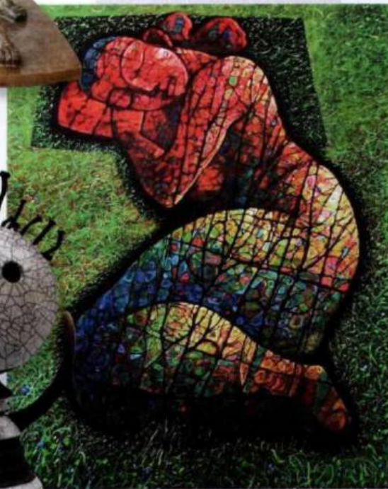
Arpad Rancz « Die schließende »

En quelques années, Linéart est ainsi devenu le point de convergence de toute une série de regards portés sur l'art moderne et contemporain et s'est hissé bien au-dessus du statut d'une simple foire d'art international, développant des initiatives de fond et proposant au public un programme des plus appétissants et diversifiés. Comme l'année dernière, le vernissage du 2 décembre coïncidera avec la Nuit des musées et l'ouverture de la Semaine de l'Art à Gand. Cette année, Linéart proposera également un Focus sur Singapour et décernera plusieurs récompenses à l'occasion du Lineart Award Event, le samedi 4 décembre dès 19h30. Une occasion parmi beaucoup d'autres de découvrir ce salon devenu incontournable.